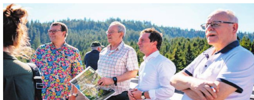
Wir brauchen eine Weiterentwicklung des Nationalparks – konzeptionell und räumlich.