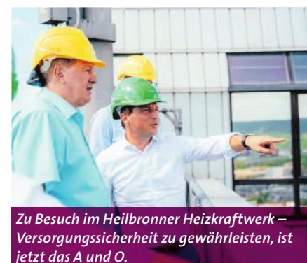
Zu Besuch im Heilbronner Heizkraftwerk – Versorgungssicherheit zu gewährleisten, ist jetzt das A und O.