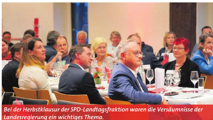
Bei der Herbstklausur der SPD-Landtagsfraktion waren die Versäumnisse der Landesregierung ein wichtiges Thema.