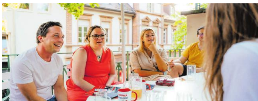
Im Freiburger Biergarten – Diskussion über alles, was den Jusos unter den Nägeln brennt.