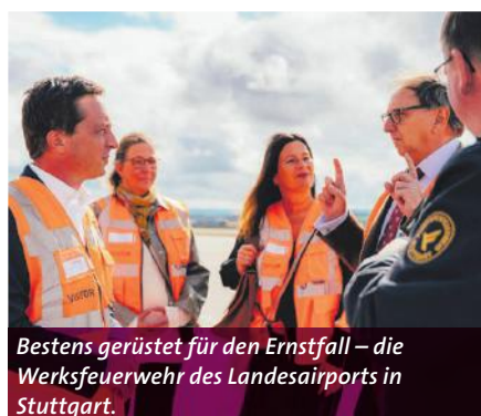
Bestens gerüstet für den Ernstfall – die Werksfeuerwehr des Landesairports in Stuttgart.